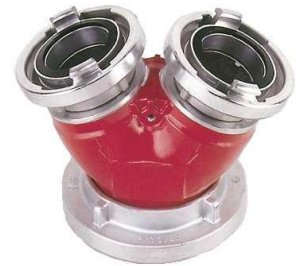
H/h Sammelstück A-2B