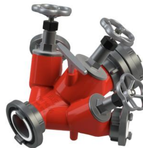
Z/z Verteiler B-CBC